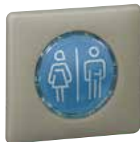
0 676 51 + πλαίσιο Clay 0 667 11