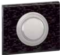
0 670 68 + πλαίσιο Pixel Leather 0 694 51

Πίνακας επιλογής για πλακίδια σελ. 269 , πλαίσια σελ. 272-275 και βάσεις στήριξης σελ. 276-277